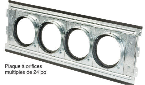
Plaque à orifices multiples de 24 po