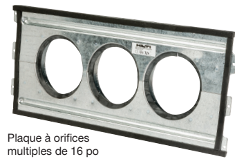
Plaque à orifices multiples de 16 po